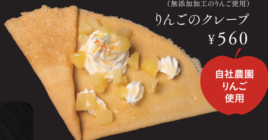
(無添加加工のりんご使用) りんごのクレープ ¥560