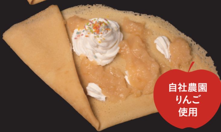
りんごバタークレープ ¥530