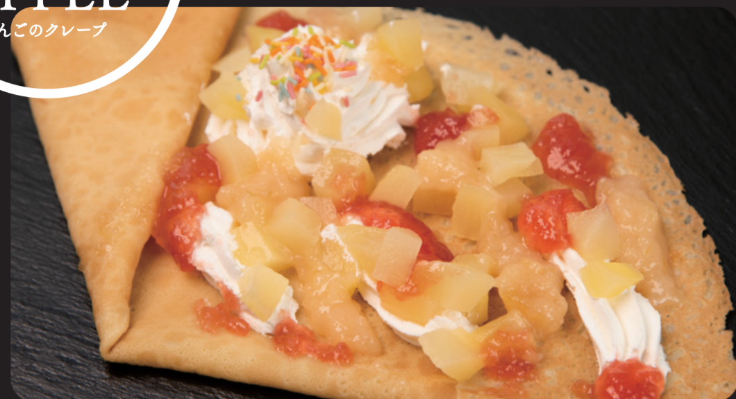
アップルヴィレッジクレープ ¥880