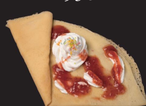
いちごジャムクレープ ¥540