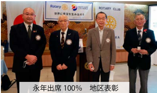
永年出席 100% 地区表彰