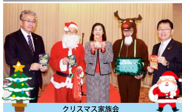
クリスマス家族会

12月23日(火) 🌙 年忘れ例会 1月13日(火) ☀️ 新年会員卓話 1月20日(火) ☀️ 新年干支会員卓話 1月27日(火) 🎉 新年交礼会 2月 3日(火) 🎉 深川ロータリークラブ創立記念日 2月10日(火) 🏠 法廷休会