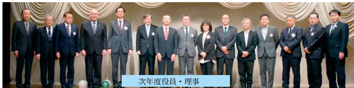
次年度役員・理事