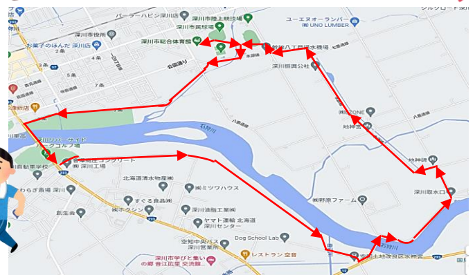
ちよっときついぞ10kmコース 横断!!北空知頭首工

お申込み・お問い合わせは深川市スポーツ協会まで(TEL 22-1144・FAX 22-5356) たくさんのご参加お待ちしております!!