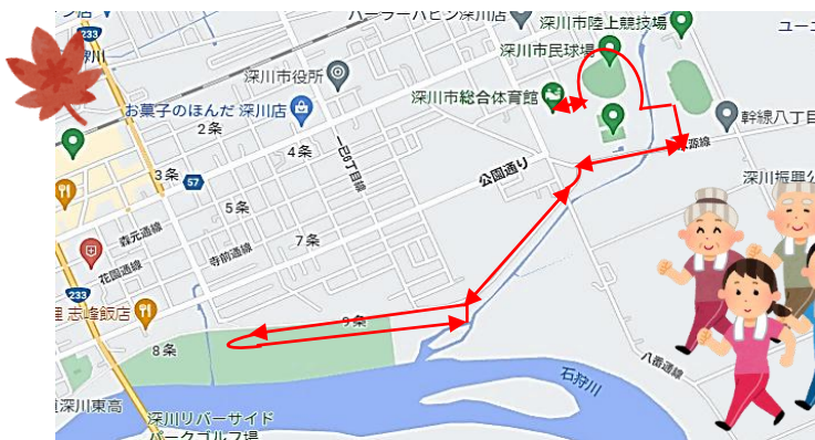
らくらく5kmコース 堤防河川敷めぐり